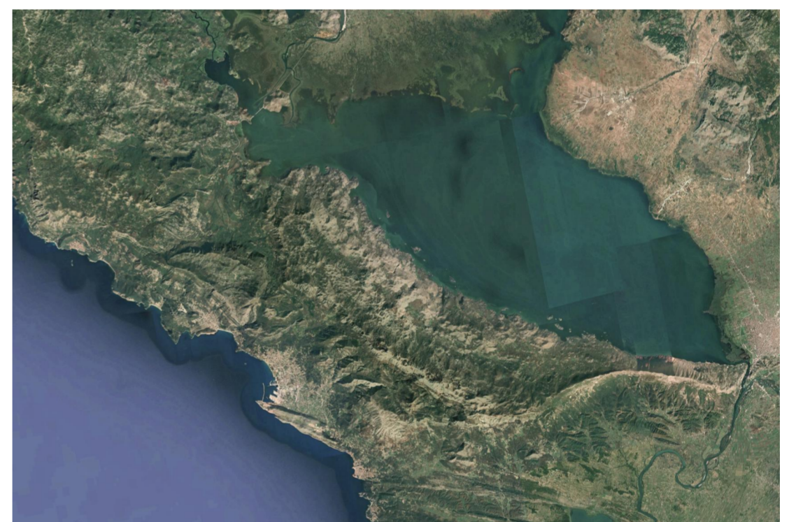
PARK NA DVIJE OBALE U GRADU NA DVIJE OBALE

Kompletan koncept prirode se oslanja na umjetničku dimenziju u prostoru koji simulira "likovni slikarski potez" kroz tzv. prirodne meandre koji se "rasipaju" i prožimaju kroz parcelu, pa tako forma ovog parka dobija nepravilne, organske i fluidne poteze koji su rezultat promišljanja elemenata iz prirode - iz Skadarskog jezera i mora.